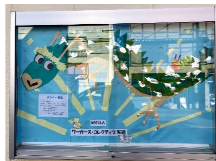
実結の掲示板 横尾