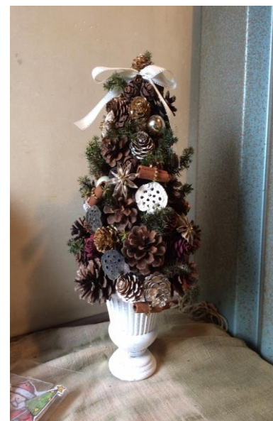
S様のクリスマスツリー

AH様の椿の貼り絵は初めて作られた作品です。50代から始めて現在も続けていらっしゃいます。愛犬「レオン」の貼り絵も素敵ですね。色の濃淡を出すのがとても難しいそうです。 記 武藤