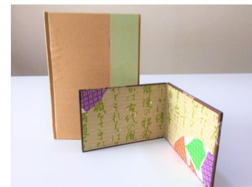
S介護士さんの手帳、ミニ屏風 —包装紙や残り布で—