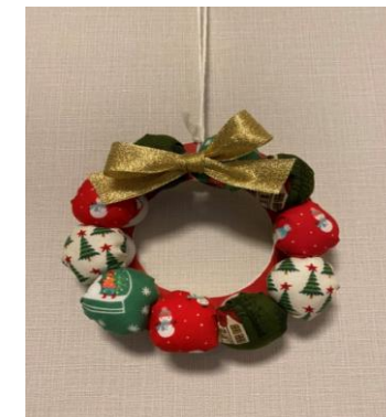
M介護士さんの布リース